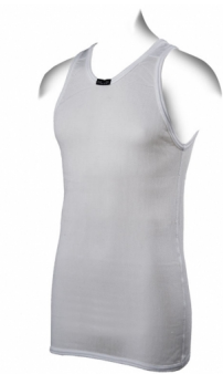
white super thermo A shirt.jpg